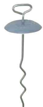
マルチロックピン