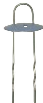
マルチU型ロックピン