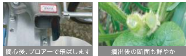
摘心後、プロアアで飛ばします