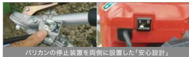
バリカンの停止装置を両側に設置した「安心設計」